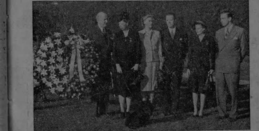
Familiares de Róosevelt acompañados por el Sr. Henry Morgenthau (izquierda) presenciando la ceremonia conmemorativa celebrada recientemente en Hyde Park, Nueva York, en honor al insigne estadista.

KANSAS CITY, Misuri.—El Presidente Truman se hizo partícipe del sentido tributo que la nación entera dedicó a Franklin D. Róosevelt con motivo del segundo aniversario de su muerte—doce de abril—durante un programa conmemorativo iniciado por la radio en Hyde Park, Nueva York. El Presidente Truman, que se encontraba en dicha fecha visitando a su anciana madre, cerca de Kansas City, participó en un programa radiofónico nacional, y manifestó que el mejor homenaje tributado al ilustre estadista está en la simpatía natural que su carácter y su personalidad inspiraron en la gente de todo el mundo. "Aún más imponente que un monolito de mármol," dijo Mr. Truman, "y más impresionante que cualquier cosa impresa o tallada en piedra es la peregrinación interminable a esa tumba situada al abrigo de un seto de abetos en la ribera del Hudson." "El tiempo confirmará en debida forma el lugar eminente que corresponde en la historia a Franklin Róosevelt. Ni yo ni ninguno de mis contemporáneos debemos intentar medir su gran talla o estimar el efecto que tuvieron sus palabras y sus actos en el curso de su época. . . . Creo sobre todas las cosas que era un gran humanitario; que infundió esperanzas y ánimo a los corazones abatidos cuando el temor estaba destruyendo la fe del pueblo; y que a través de la más espantosa guerra de la his-